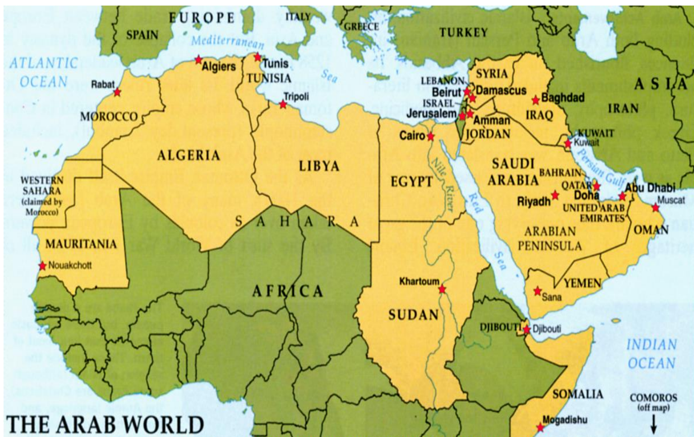
Σχήμα 2.1 : Χάρτης Αραβικού κόσμου

Τέλος, θα αναφερθούμε συνοπτικά στο πρόσφατο φαινόμενο της Αραβικής Άνοιξης. Πρόκειται για ένα κύμα διαδηλώσεων ενάντια των κυβερνώντων αρχών στις αραβικές χώρες, σε απολυταρχικά καθεστώτα μακράς διακυβέρνησης (Policy brief: The European Union's Response Toward The Arab Spring). Η αρχή έγινε τον Δεκέμβριο του 2010 στην Τυνησία. Ακολούθησαν μεγάλες εξεγέρσεις που συνεχίζονται μέχρι σήμερα σε Τυνησία, Αίγυπτο, Λιβύη, Μπαχρέιν, Συρία, Υεμένη.