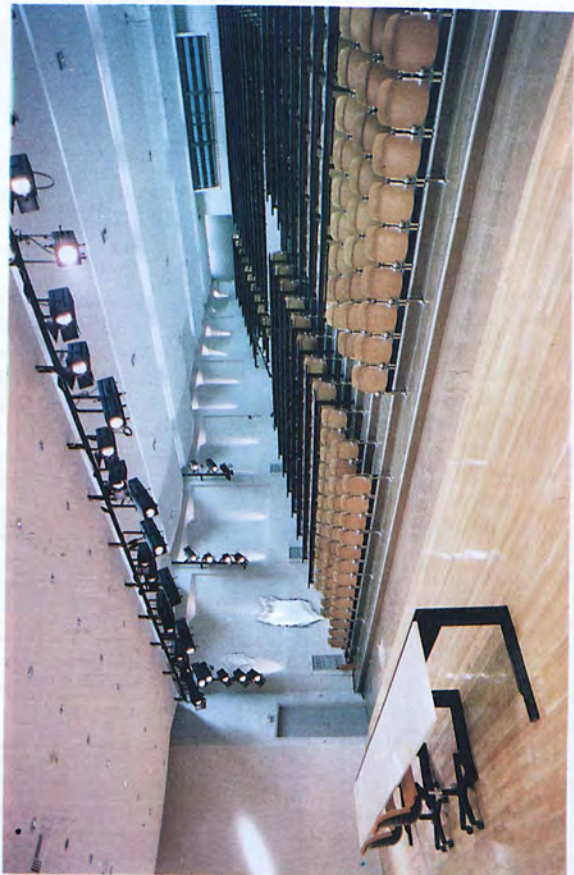
Μεγάλο Αμφιθέατρο για Διδασκαλία