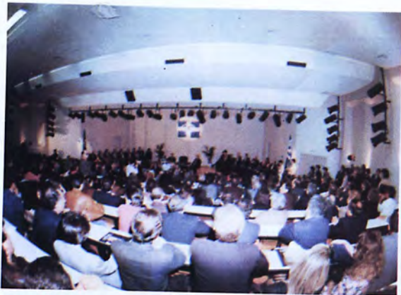
Εγκαίνια Νέων Κτιριακών Εγκαταστάσεων 1993.