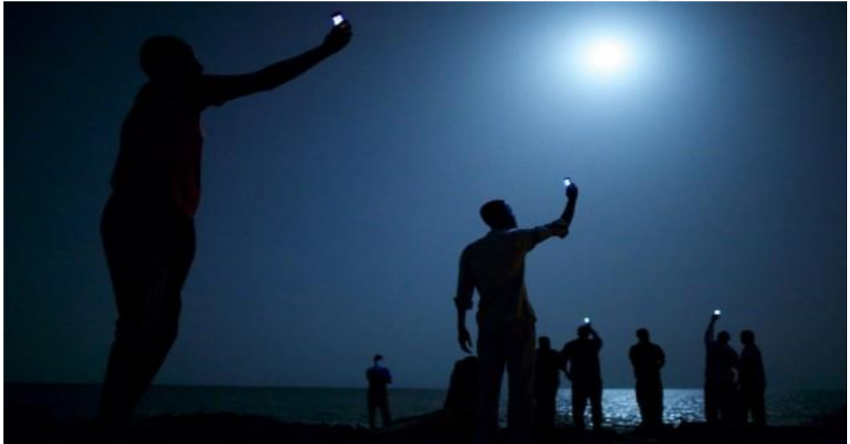
Εικόνα 3: World Press Photo of the Year 2013

Θα ήθελα να κλείσω αυτή την εργασία με μια φωτογραφία που έχει άμεση σχέση με το φαινόμενο της μετανάστευσης και η οποία ψηφίστηκε ως η «Φωτογραφία της χρονιάς 2013». Η φωτογραφία είναι ενός αμερικανού φωτογράφου. Στη φωτογραφία απεικονίζονται αφρικανοί μετανάστες οι οποίοι βρίσκονται στην ακτή της Πόλης του Τζιμπουτί και προσπαθούν να βρουν σήμα, με σκοπό να επικοινωνήσουν με συγγενείς τους.