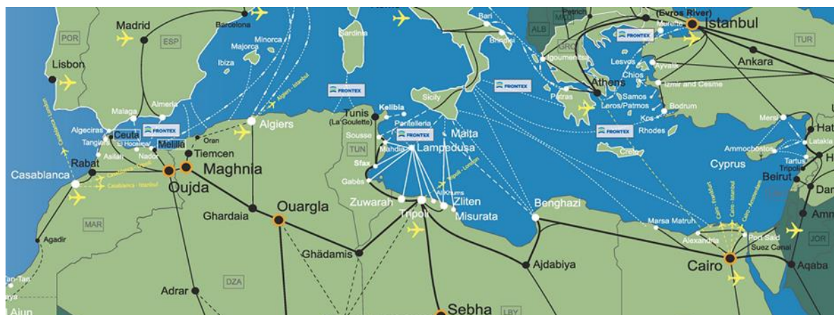
Εικόνα 2. Χάρτης από την επίσημη ιστοσελίδα του οργανισμού “Frontex” με τίτλο «Map on irregular and mixed migration routes»