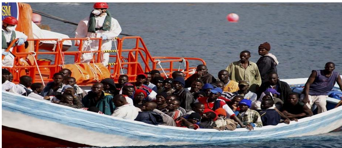
Εικόνα 1. Φωτογραφία από άρθρο στο Skai.gr με τίτλο «Κρήτη: Εντοπίστηκαν δεκάδες παράνομοι μετανάστες»