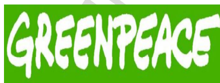
Σύμβολο 11: Εθελοντική οργάνωση greenpeace

Η ονομασία της Unicef προέρχεται από τα αρχικά των αγγλικών λέξεων United Nations International Children's Emergency Fund (Διεθνές Έκτακτο Ταμείο των Ηνωμένων Εθνών για τα Παιδιά). Η οργάνωση των Ηνωμένων Εθνών για τα παιδιά ιδρύθηκε στις 11 Δεκεμβρίου 1946 για να βοηθήσει τα παιδιά της Ευρώπης, της Μέσης Ανατολής και της Κίνας μετά το τέλος του Β' Παγκόσμιου Πολέμου. Το 1953 γίνεται μόνιμο τμήμα συστήματος των Ηνωμένων εθνών με τα γραφεία τους στη Ν. Υόρκη και αποστολή της είναι η κάλυψη των μακροπρόθεσμων αναγκών των φτωχών παιδιών των αναπτυσσόμενων χωρών.