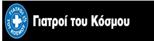
Σύμβολο 4: Εθελοντική οργάνωση οι Γιατροί του Κόσμου

Είναι μία Μη Κυβερνητική, ανεξάρτητη, ανθρωπιστική διεθνής οργάνωση. Ιδρύθηκαν στη Γαλλία το 1980 από τον Γάλλο γιατρό Bernard Couchner, μετέπειτα Υπουργό Υγείας και Ανθρωπιστικής Δράσης της Γαλλίας. Ο Couchner υπήρξε ένας από τους «French Doctors», μία ομάδα Γάλλων γιατρών, που το 1968 αποφάσισαν να παρέμβουν οργανωμένα στο δράμα του λιμού της Μπιάφρα. Σε όλο τον κόσμο, οι Γιατροί του Κόσμου δρουν με την ίδια αυταπάρηση, αλλά και με την αποτελεσματικότητα και σοβαρότητα που επιβάλλουν ο ανθρώπινος πόνος και η δυστυχία.