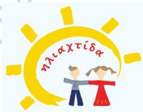
Σύμβολο 8: Εθελοντική οργάνωση Ηλιαχτίδα

Ο Εθελοντικός Οργανισμός για τα παιδιά, «Το Χαμόγελο του Παιδιού» από δημιουργίας του βασίζεται στην αγάπη και στην προσφορά του κόσμου για να καλύψει τις ανάγκες που καθημερινά προκύπτουν και να πετύχει το μεγάλο του στόχο, να έχουν όλα τα παιδιά ένα χαμόγελο. Σε αυτήν την προσπάθεια πολύτιμοι αρωγοί είναι οι εθελοντές, που με τη δική τους προσφορά συμβάλλουν ουσιαστικά στη συνέχιση του έργου.