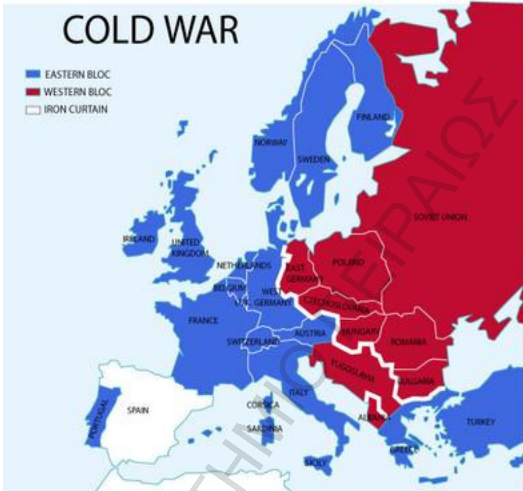
Σχήμα 1.3 : A map of the Cold War, demonstrating the “Iron Curtain”

των δυο πόλων, επιδιώκοντας την πραγματοποίηση της εσωτερικής νομιμοποίησης σε πρώτο επίπεδο και της εξωτερικής νομιμοποίησης ακολούθως 189 .