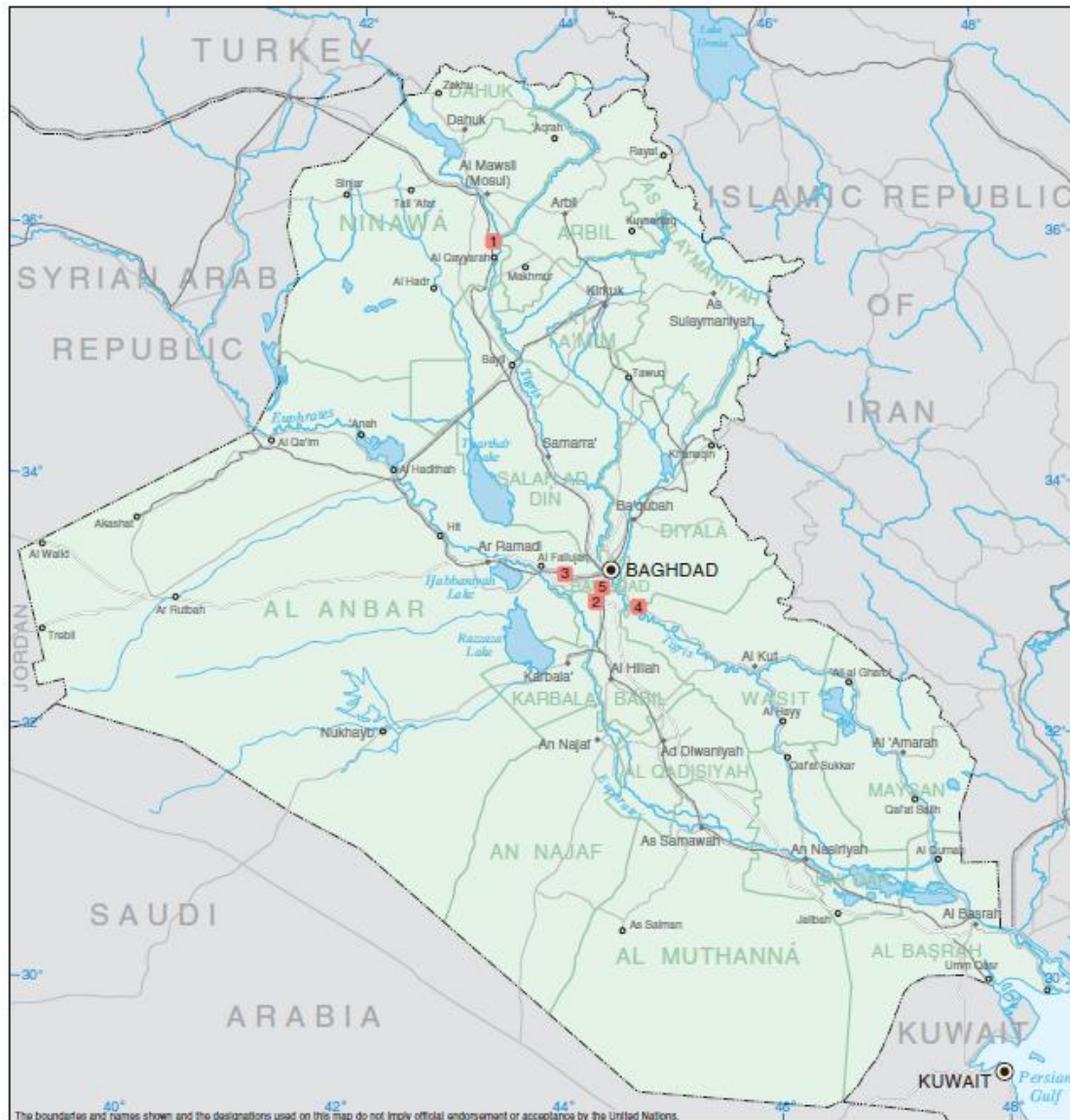
Πίνακας 4.1 (Θερμές Ζώνες του Ιράκ) 2

Στον παρακάτω πίνακα καταγράφονται οι θερμές ζώνες του Ιράκ στις οποίες η ρύπανση παρατηρήθηκε σε υψηλά ποσοστά.