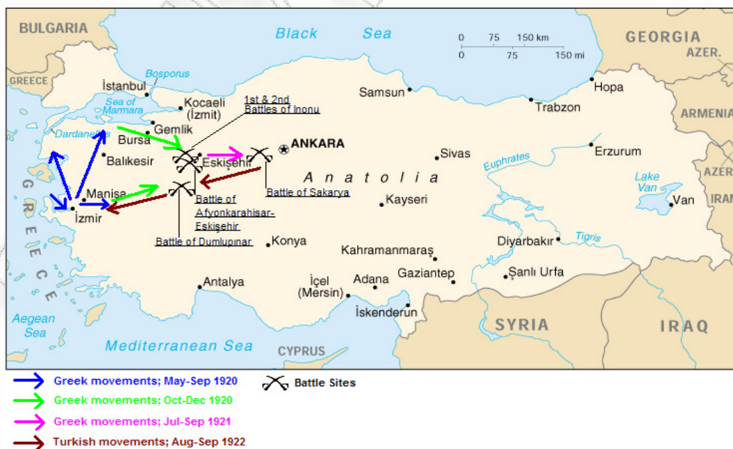
Εικόνα 1: Οι πολεμικές επιχειρήσεις της Μικρασιατικής Εκστρατείας

Συνεπώς, η Τουρκία παρόλο που το 1919 δεν ήταν έτοιμη για πόλεμο και υστερούσε έναντι της Ελλάδας, συνειδητοποίησε εγκαίρως ότι από τον αγώνα αυτό κρινόταν η επιβίωση της και έτσι χρησιμοποίησε όλα της τα μέσα προκειμένου να πετύχει τον πολιτικό της σκοπό, την αναθεώρηση της συνθήκης των Σεβρών, χωρίς να υπερεκτιμά τις δυνατότητές της. Τουναντίον αναγνώριζε την αδυναμία της και επιζητούσε χρόνο τον οποίο και κέρδισε με την επιλογή της κατάλληλης στρατηγικής. Επιπροσθέτως, ο εθνικισμός που αναπτύχθηκε επενεργούσε θετικά και στο ηθικό του στρατού, σημαντικός παράγοντας για τη νίκη σε τακτικό επίπεδο. Τελικά, εκμεταλλευόμενη το χρόνο, κάθε δυνατή ευκαιρία και κάθε υπεροχή της έναντι του αντιπάλου ή τρωτότητα αυτού, και ενεργώντας προετοιμασμένη και με σχέδιο, κατάφερε να αντιστρέψει τους όρους του παιχνιδιού και να επιβληθεί στρατιωτικά και πολιτικοδιπλωματικά.