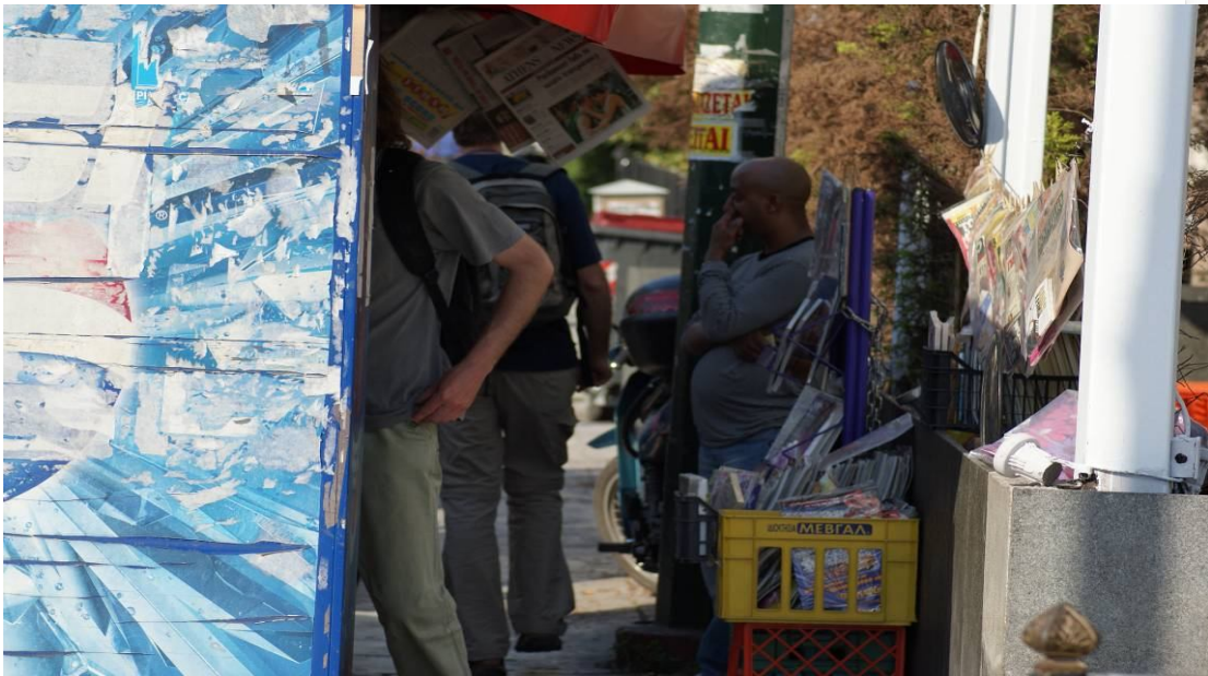
Φωτογραφία 1: «Παραβάσεις Καταπάτησης Κοινόχρηστου Χώρου»

Σύμφωνα με την παραπάνω φωτογραφία (1) εύκολα μπορεί κανείς να διαπιστώσει πως ο ιδιοκτήτης του συγκεκριμένου περιπτέρου έχει τοποθετήσει καφάσια και πτυσσόμενες βάσεις με περιοδικά απέναντι από το περίπτερο, κλείνοντας ένα μέρος του πεζοδρομίου και παρακωλύοντας την ελεύθερη διέλευση των πεζών. Αυτό φυσικά αποτελεί παράνομη πράξη, καθώς σύμφωνα με την Κ.Υ.Α. 52488/2002, άρθρο 2, παρ.1, σε όλους τους κοινόχρηστους χώρους 50 που προορίζονται για τη κυκλοφορία πεζών, επιβάλλεται ελεύθερη ζώνη πεζών με απαραίτητο ελάχιστο πλάτος 1.50 μ. ελεύθερο από κάθε είδους εμπόδιο που χρησιμοποιείται για τη συνεχή, ασφαλή και ανεμπόδιστη κυκλοφορία κάθε κατηγορίας χρηστών. Με μία απλή ματιά παρατηρεί κανείς πως το απαιτούμενο πλάτος δεν έχει τηρηθεί.