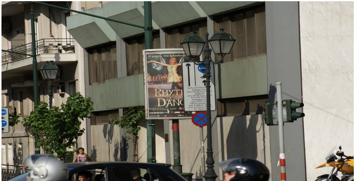
Φωτογραφία 2: «Παραβάσεις του Νόμου περί Διαφημιστικών Πλαισίων»

Αρκετές είναι και οι παραβάσεις που διαπιστώνονται και στη δεύτερη (2) φωτογραφία με το διαφημιστικό πλαίσιο τύπου «ΡΑΚΕΤΑ». Αρχικά παρατηρούμε ότι η διαφημιστική πινακίδα βρίσκεται πίσω και σε εξαιρετικά μικρή απόσταση από τις πινακίδες σήμανσης οδικής κυκλοφορίας, γεγονός που απαγορεύεται βάσει του άρθρου 11, παρ.2 του Κ.Ο.Κ. καθώς μπορεί να προκαλέσει σύγχυση στους οδηγούς μή βλέποντας την πινακίδα, και γενικά να αποσπάσει την προσοχή τους κατά τρόπο που μπορεί να έχει δυσμενή επίδραση στην οδική τους ασφάλεια.