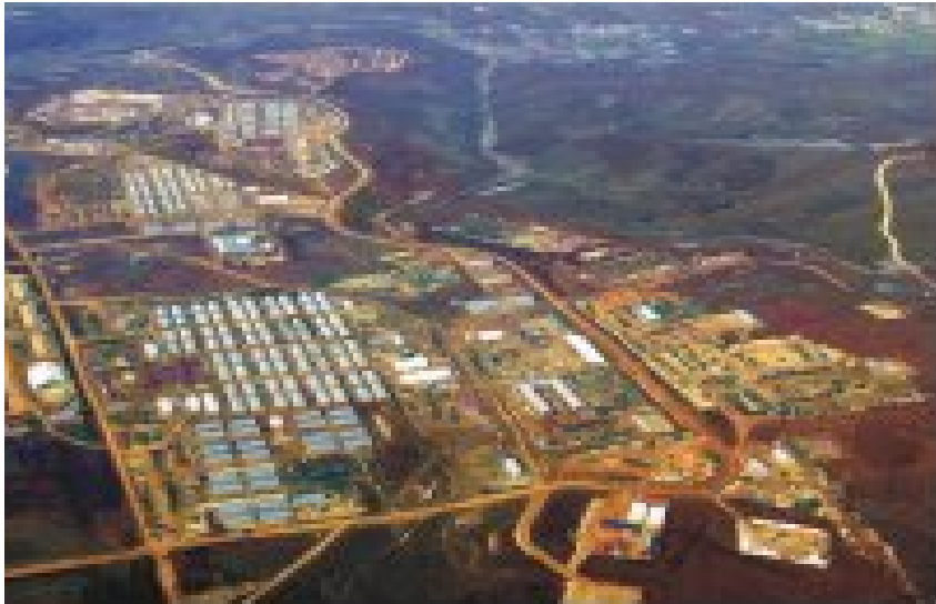
Camp Bondsteel, 15 October 1999

Χάρτης 2 : Η αποκαλούμενη «Δημοκρατία του Κοσσυφοπεδίου».