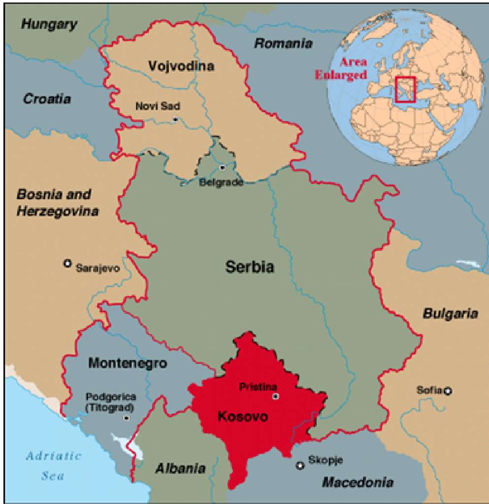
Χάρτης 2 : Πορεία διέλευσης διαβαλκανικού αγωγού AMBO.