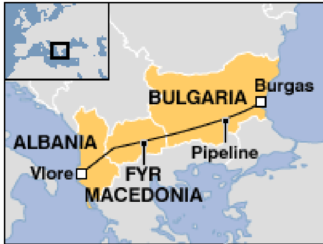
Χάρτης 3 : Ο σχεδιασμός και τα δίκτυα του ρωσικού συστήματος τροφοδοσίας φυσικού αερίου.