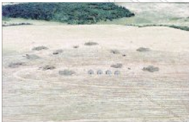
Camp Bondsteel, 15 June 1999

Φωτ. 1-3 : Η αμερικανική βάση Μπόντστιλ (Camp Bondsteel) στο Ουρόσεβατς του Κοσσυφοπεδίου.