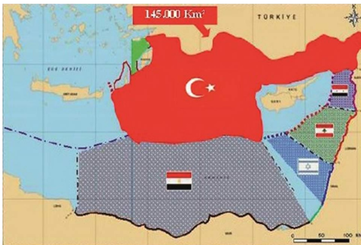
Εικόνα 2: Στον παραπάνω χάρτη απεικονίζονται οι ενδεχόμενες ΑΟΖ οι οποίες και μπορούν να δημιουργηθούν με τα γειτονικά της κράτη, σύμφωνα πάντα με την τουρκική άποψη.

Καλό επίσης θα ήταν να αναφερθούμε και στην μελέτη του τουρκικού think tank "Bigesam", του οποίου και οι απόψεις λαμβάνουν καθολική αποδοχή από την πολιτική και στρατιωτική ηγεσία της χώρας. Η μελέτη αναφέρει 111 την μη αναγνώριση της Κυπριακής Δημοκρατίας ως κράτους καθώς και τις περιπτώσεις μιας πιθανής οριοθέτησης θαλασσίων ζωνών με την Αίγυπτο, την Λιβύη, το Λιβανό και το Ισραήλ. Η Κύπρος αγνοείται πλήρως και η διευθέτηση των ΑΟΖ με τα υπόλοιπα κράτη, είναι ικανή να τους εξασφαλίσει περισσότερο γεωγραφικό χώρο και συνεπώς μεγαλύτερες ΑΟΖ ως προς εκμετάλλευση. Επίσης παραθέτει διαφορές κατά καιρούς αποφάσεις του Διεθνούς Διαιτητικού Δικαστηρίου, όπου το κράτος που διαθέτει μεγαλύτερη φυσική ακτογραμμή δικαιούται και μεγαλύτερης εκτάσεως υφαλοκρηπίδα σε βάρος ενός κράτους το οποίο και είναι νησιωτική ήπειρος.