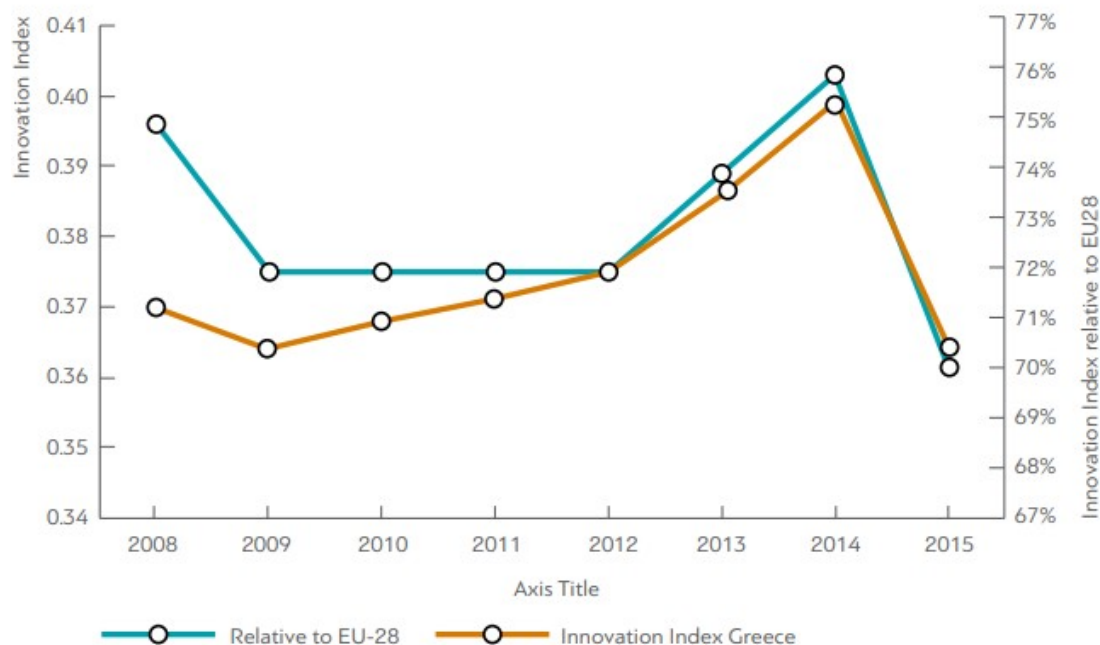
Εικόνα 1. Δείκτης καινοτομίας της Ελλάδας 2008-2015.

Όλοι οι παραπάνω παράγοντες είναι σημαντικοί για τη διαμόρφωση της καινοτομίας και της επιχειρηματικότητας στην Ελλάδα. Στο διάγραμμα που ακολουθεί παρουσιάζεται ο σχετικός δείκτης για τη χώρα από το 2008 έως και το 2015.