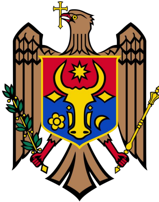
Ο θυρεός της Δημοκρατίας της Μολδαβίας, ο οποίος προέρχεται από τον θυρεό του Πριγκιπάτου της Μολδαβίας