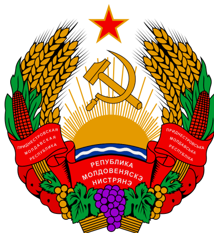
Ο θυρεός της Υπερδνειστεριακής Μολδαβικής Δημοκρατίας, ο οποίος προέρχεται από τον θυρεό της Μολδαβικής Σοβιετικής Σοσιαλιστικής Δημοκρατίας