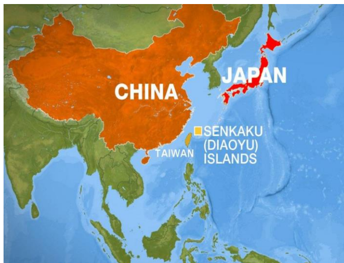
Εικόνα 2

Η επόμενη πρόκληση της κινεζικής εξωτερικής πολιτικής αφορά την θάλασσα της ανατολικής Κίνας αυτή τη φορά η οποία την φέρνει σε αντιπαράθεση με την Ιαπωνία για τα νησιά Diaoyu ή Senkaku (Εικόνα 2), όπως λέγονται στην κινεζική και ιαπωνική γλώσσα αντίστοιχα και με τη Νότια Κορέα για την