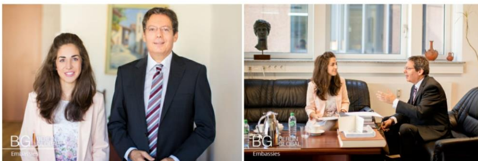
News from Berlin

In a word ... DO IT !!! They should always care for politics both within and outside their country. Relations between states are exciting because they depend on factors that can change radically. There are not friendships. There are only interests that candidate diplomats need to understand. Especially if they come from countries with problems like Cyprus and Greece should further be interested in public affairs. Seek to find a platform through which you will express your opinion, fight to bring change and diplomacy certainly will offer you the opportunity. But the most important, you should study very much, show unique interest and believe in yourselves, your abilities and the just demands of the race that you will take.