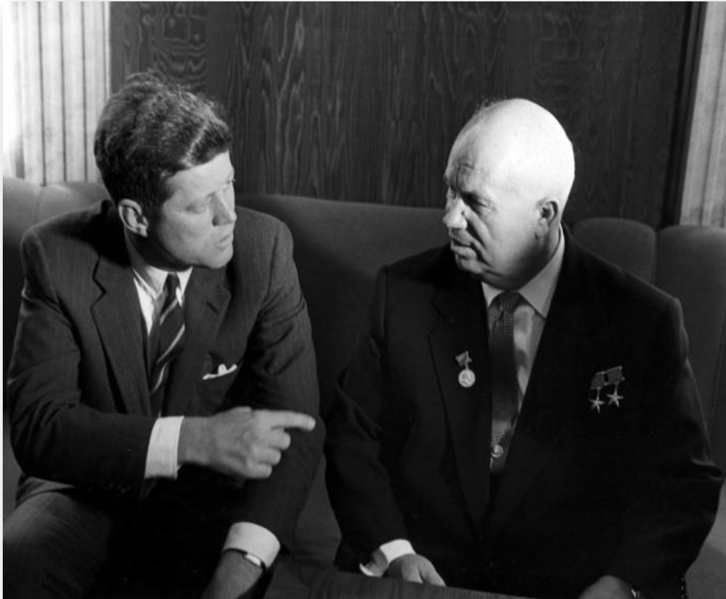
(Συνάντηση ΤΖ. Κέννεντι, Νικήτα Khrushchev στη Βιέννη 06/03/1961 – 06/04/1961). Photograph of President