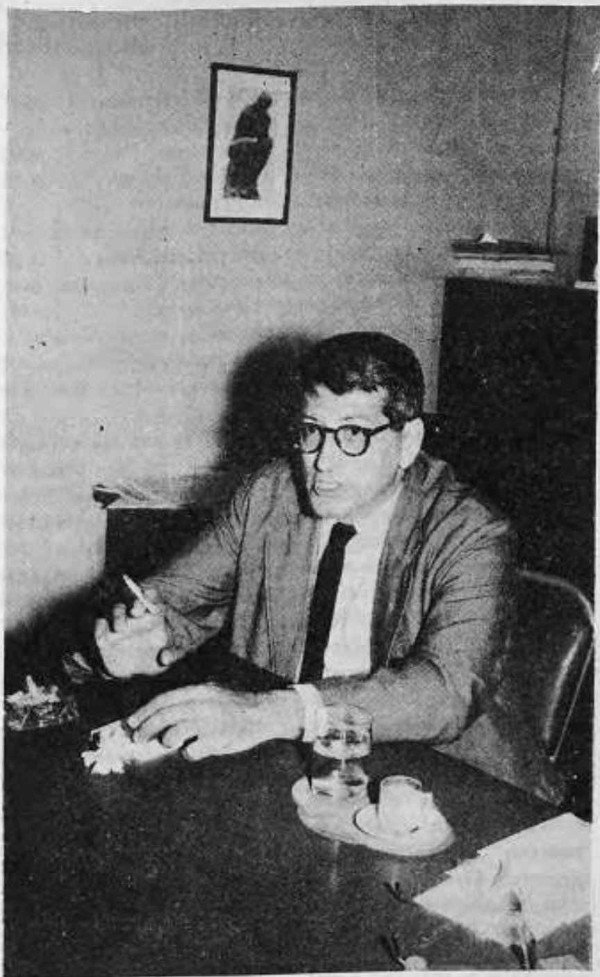
Ο Καθηγητής κ. ALEX BAVELAS