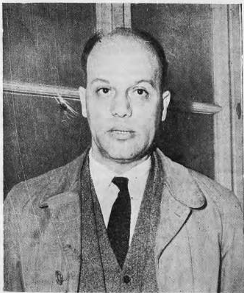
Ὁ Ὑπουργὸς Βιομηχανίας κ. ΝΙΚΟΛΑΟΣ ΜΑΡΤΗΣ