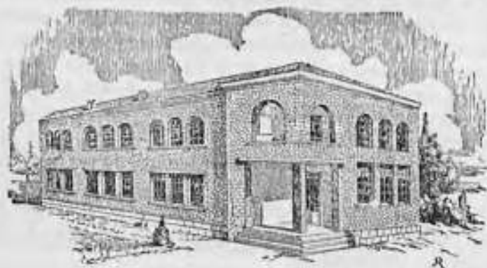
Ἡ Οἰκοκρομὴ Σχολὴ τοῦ Τεγεατικοῦ Συνδέσμου ἐν Παλαιᾷ Ἐπισκοπῇ Τεγέας. Διαθέτει αὕτη καὶ οἰκοτροφεῖον διὰ τὰς ἐκ τῶν διαφόρων περιφερειῶν τῆς Πελοποννήσου καὶ λοιπῆς Ἑλλάδος καταγομένας μαθητοίας.

Τὸ βαθύ θρησκευτικὸν συναίσθημα τῶν κατοίκων τῆς Τεγέας καὶ τῶν πολλῶν ἐκ ταύτης μεταναστῶν ἴδια εἰς τὰς Η.Π.Α. ἐφ' ἑνός, ἡ ἀμιλλα με-