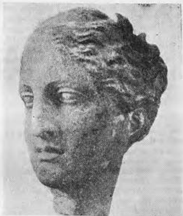
Κεφαλή τῆς Θεᾶς τῆς Ὑγιείας

τρός του και πρώτου βασιλέως αὐτῆς. Ὁ Λυκάων ἦτο σύγχρονος τοῦ Κρόκτος τῶν Ἀθηνῶν. Ἀλλαχοῦ ὁ Πausanias ἀναφέρει ὅτι πρῶτος οἰκιστὴς τῆς Τεγέας ἦτο ὁ Ἄλεος, ἡ χώρα δὲ ἔλαβε τὸ ὄνομα ἀπὸ τὸν Τεγεάτην «Τεγεᾶται δὲ ἐπὶ μὲν Τεγεάτου τοῦ Λυκάωνος τῆ χώρα φασὶν ἀπ' αὐτοῦ γενέσθαι μόνη τὸ ὄνομα, τοῖς δὲ ἀνθρώποις κατὰ δήμους εἶναι τὰς οἰκῆσεις... τῆς δὲ ἐφ' ἡμῶν πόλεως οἰκιστὴς ἐγένετο Ἄλεος». Βραδύτερον ἀνα-