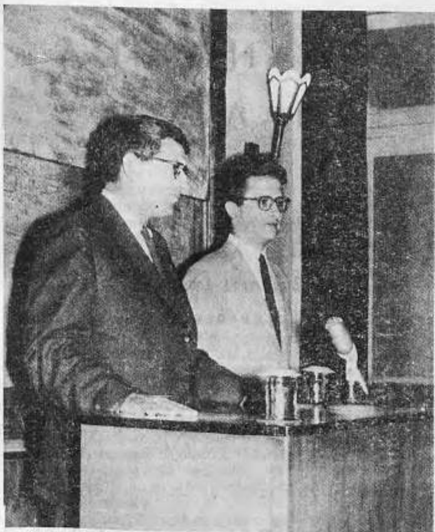
Ο Έλληνοαμερικανός Καθηγητής του Πανεπιστημίου Stanford κ. ΑΛΕΞ. ΜΠΑΒΕΛΑΣ όμιλών από της Ίδρας της Σχολής, παραπλεύρως ό διερμηνεύς του κ. Κουδύλης