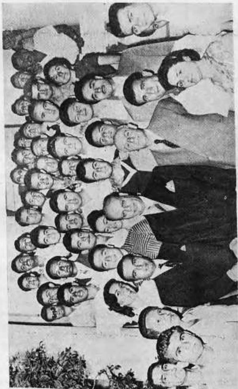
Ο Ύπουργος κ. Ν. Μάρτις εν μέσω των σπουδαστών