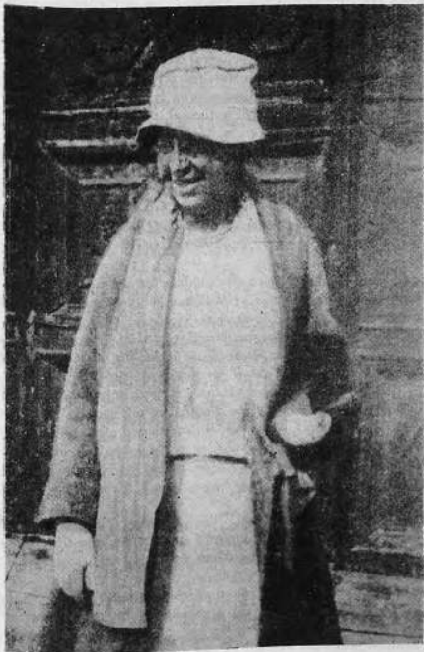
MARY PARKER FOLLETT (1868-1933)