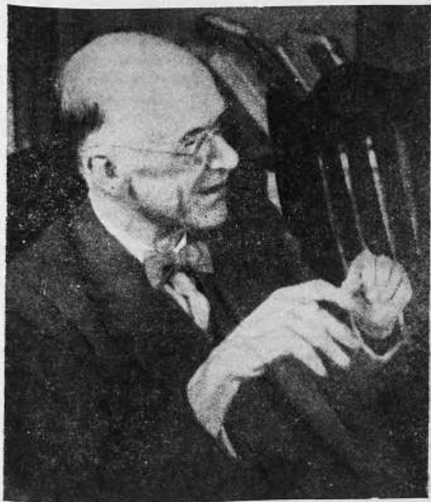
GEORGE ELTON MAYO (1880—1949)