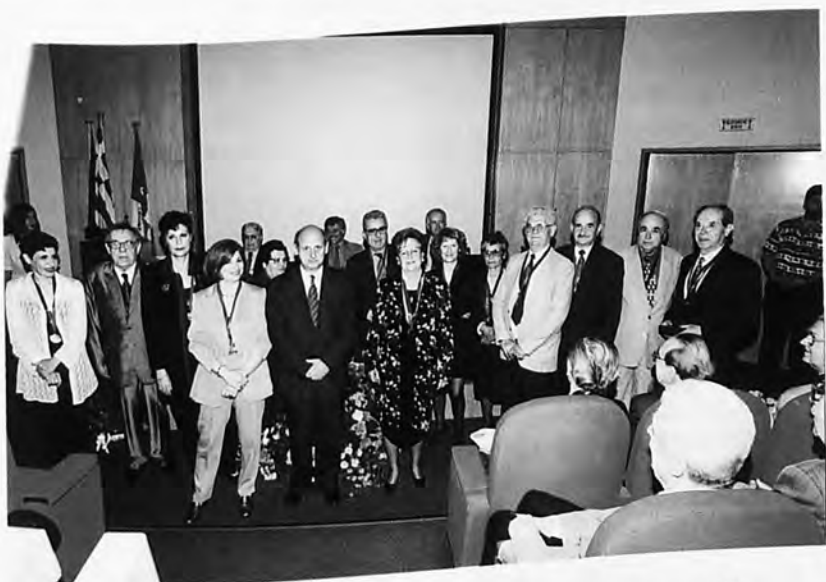
Από την απονομή τιμητικών διακρίσεων σε αποχωρήσαντα μέλη του Διοικητικού Προσωπικού.