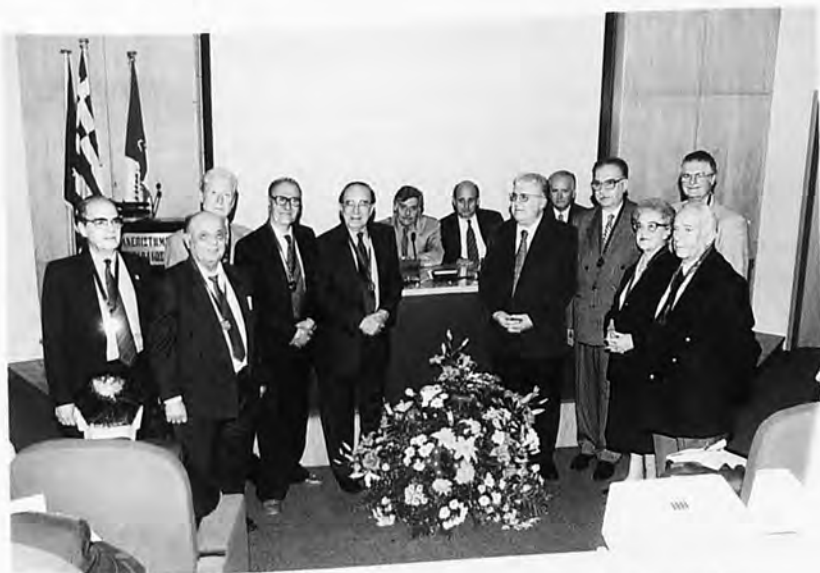
Από την απονομή τιμητικών διακρίσεων σε αποχωρήσαντα μέλη του Διδακτικού Προσωπικού.