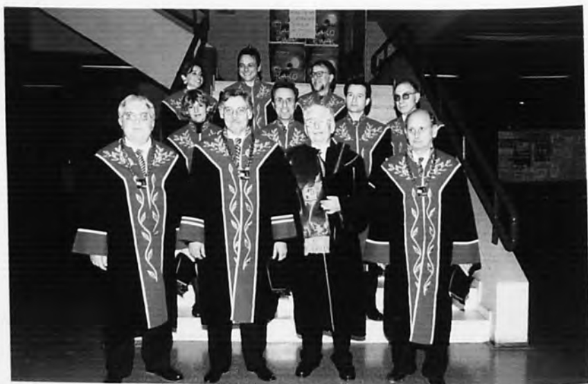
Αναγόρευση Επίτιμου Διδάκτορα κ. Ritner, Καθηγητή του Πανεπιστημίου του Freiburg Γερμανίας (19 Νοεμβρίου 1998).