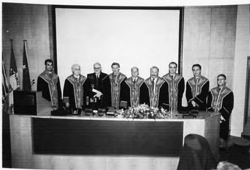
Αναγόρευση Επίτιμου Διδάκτορα κ. Richard Oliver Goss, Καθηγητή του Πανεπιστημίου της Ουαλίας του Ηνωμένου Βασιλείου (2 Ιουνίου 1999).