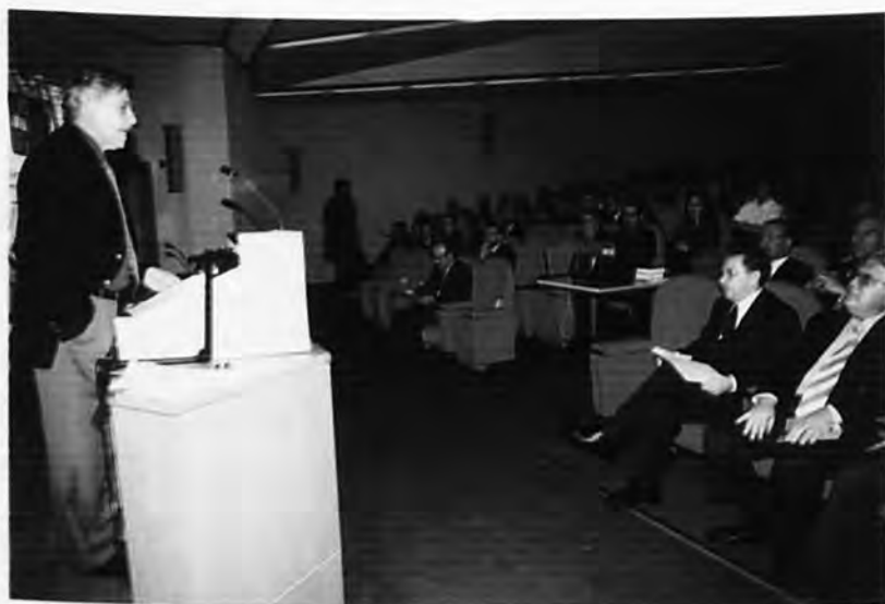
Από τα εγκαίνια του Dealing Room του Τμήματος Χρηματοοικονομικής και Τραπεζικής Διοικητικής.