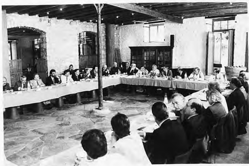
Από τη σύνοδο των Πρυτάνεων στην Ύδρα, που διοργανώθηκε από το Πανεπιστήμιο Πειραιώς (10-12/10/1997).