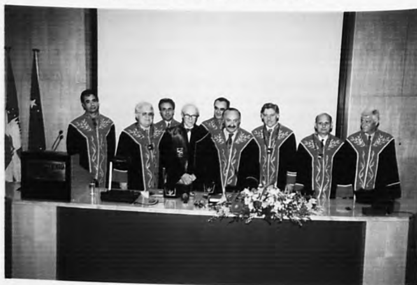
Αναγόρευση Επίτιμου Διδάκτορα κ. Lawrence Klein, Καθηγητή του Πανεπιστημίου της Πενσυλβάνιας των Η.Π.Α, κατόχου Βραβείου Νόμπελ της Οικονομίας (8 Ιουνίου 1999).