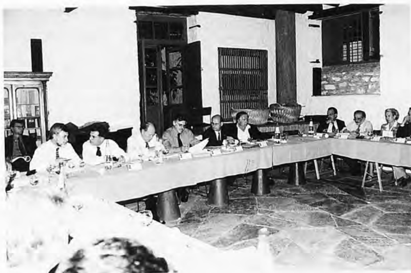
Από τη σύνοδο των Πρυτάνεων στην Ύδρα, που διοργανώθηκε από το Πανεπιστήμιο Πειραιώς (10-12/10/1997).