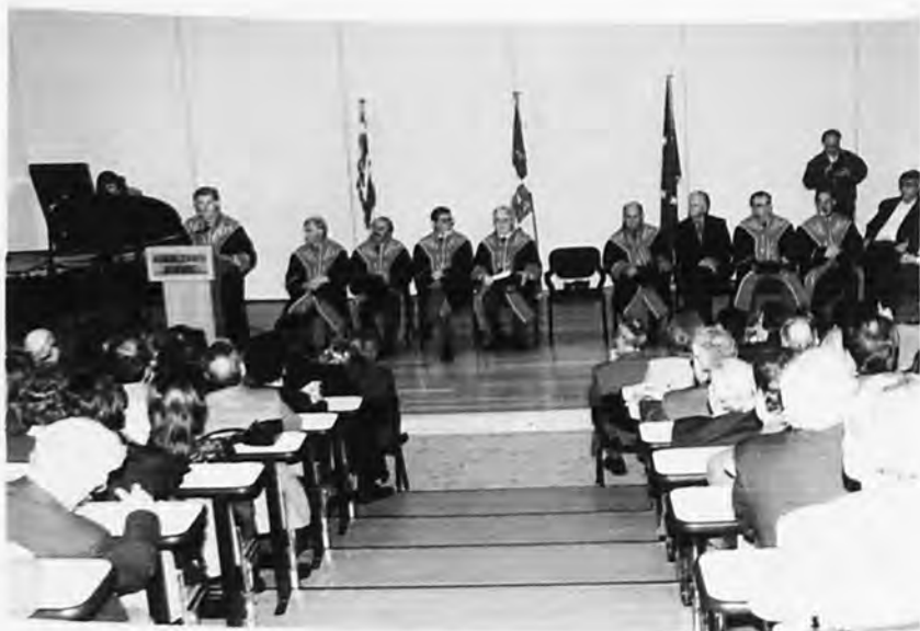
Από εκδήλωση εορτασμού των 60 χρόνων λειτουργίας του Πανεπιστημίου.