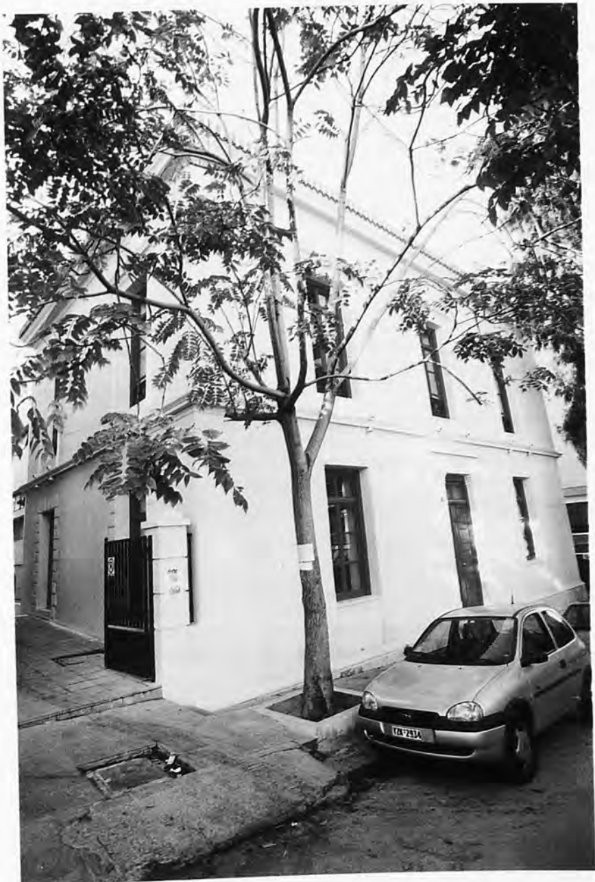
Το ανακαινισθέν νεοκλασικό κτίριο του Πανεπιστημίου.