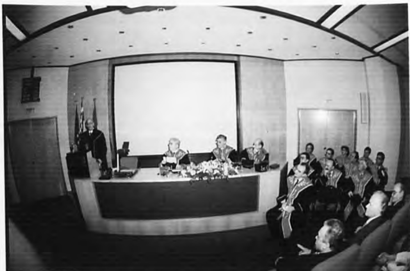
Αναγόρευση Επίτιμου Διδάκτορα κ. Chris Argyris, Καθηγητή του Πανεπιστημίου Harvard των Ηνωμένων Πολιτειών της Αμερικής (4 Μαΐου 1998).