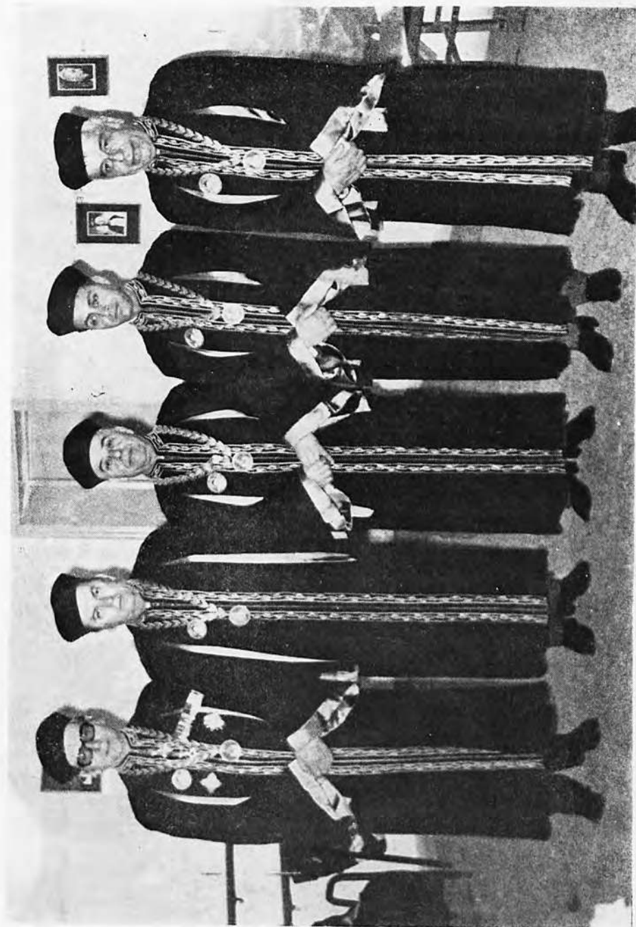
Η Σύγκλητος τῆς Σχολῆς