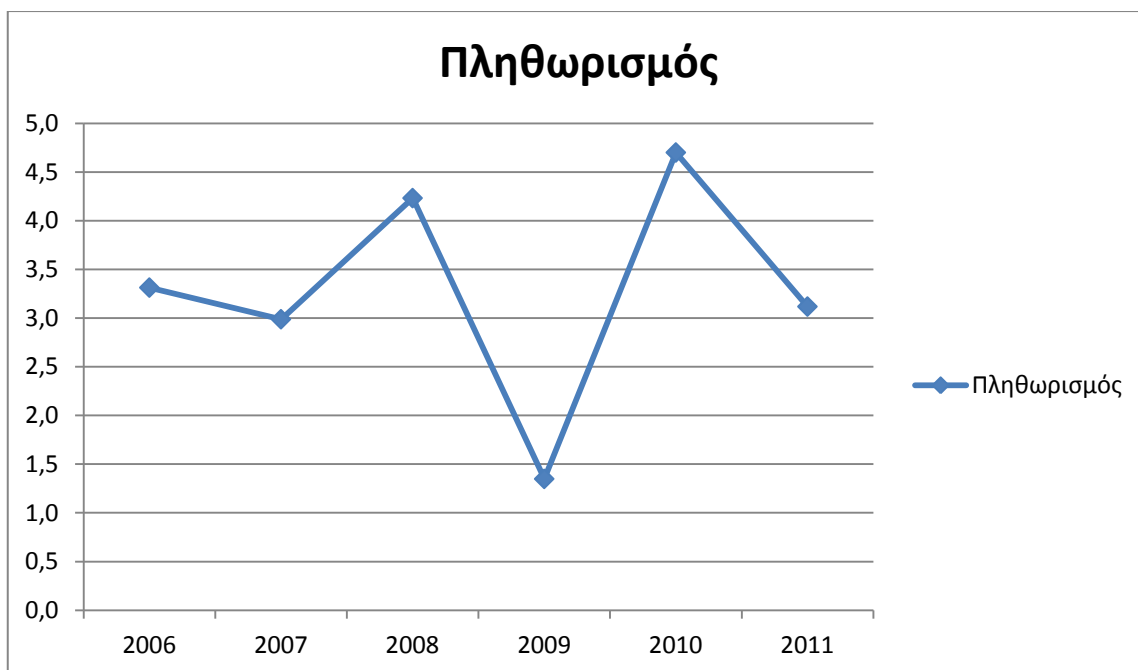
Διάγραμμα 1. Πληθωρισμός Ελλάδος, Έτη 2006-2011