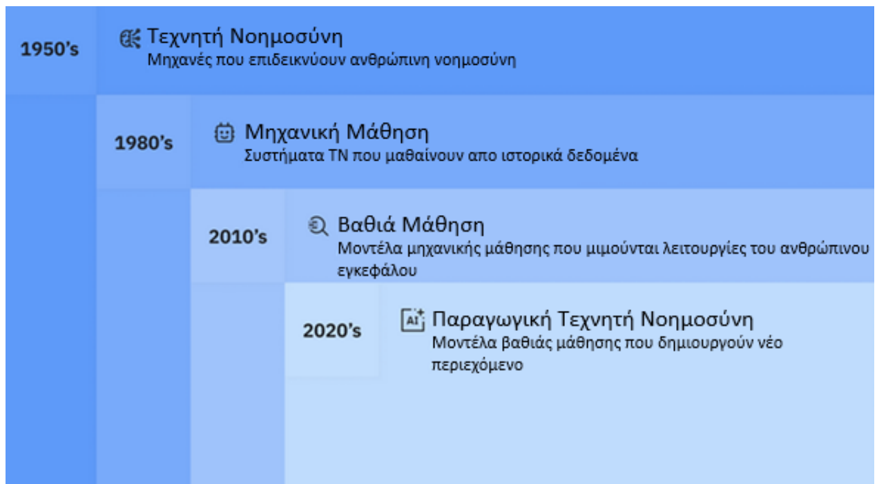
Εικόνα 1 Τεχνητή νοημοσύνης, Μηχανική και Βαθιά μάθηση

Η βαθιά μάθηση χρησιμοποιεί πολλαπλά νευρωνικά δίκτυα τα οποία προσομοιώνουν με μεγαλύτερη ακρίβεια την πολύπλοκη διαδικασία λήψης αποφάσεων του ανθρώπινου εγκεφάλου. Σε αυτή την προσέγγιση τα νευρωνικά δίκτυα περιλαμβάνουν ένα επίπεδο εισόδου, συνήθως εκατοντάδες κρυφά ενδιάμεσα επίπεδα και ένα επίπεδο εξόδου, σε αντίθεση με τα νευρωνικά δίκτυα της μηχανικής μάθησης, τα οποία συνήθως έχουν μόνο ένα ή δύο κρυφά ενδιάμεσα επίπεδα (Stryker & Kavliakoglu, 2024). Αναπαράσταση ενός απλού νευρωνικού δικτύου προώθησης με 3 κρυφά επίπεδα παρατίθεται στην εικόνα 3 (IBM, 2025).