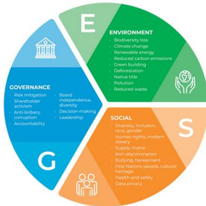
Σχήμα 3: Οι τρεις πυλώνες του πλαισίου ESG (Environmental – Social – Governance)

Η έννοια των κριτηρίων ESG (Environmental, Social, Governance) αποτελεί το βασικό αναλυτικό και αξιολογικό πλαίσιο μέσω του οποίου αποτυπώνεται πλέον η συνολική επίδοση, υπευθυνότητα και ανθεκτικότητα των επιχειρήσεων. Το πλαίσιο ESG υπερβαίνει την παραδοσιακή χρηματοοικονομική πληροφόρηση, ενσωματώνοντας περιβαλλοντικές, κοινωνικές και διακυβερνητικές διαστάσεις, οι οποίες επηρεάζουν ουσιαστικά τη μακροπρόθεσμη αξία και βιωσιμότητα των οργανισμών (OECD, 2020). Η υιοθέτηση των ESG κριτηρίων αντανάκλα τη μετατόπιση από ένα στενά οικονομικό μοντέλο αξιολόγησης σε μια ολιστική προσέγγιση επιχειρησιακής επίδοσης.