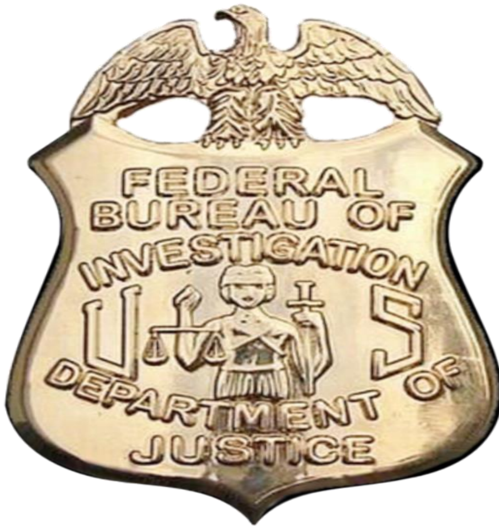
Εικόνα 6: Το σήμα των ειδικών πρακτόρων που εργάζονται στην Ομοσπονδιακό Γραφείο Ερευνών.

Συνεχίζοντας την ανάλυση των υπηρεσιών πληροφοριών που υπάγονται στην κοινότητα των Η.Π.Α. η επόμενη υπηρεσία είναι το Ομοσπονδιακό Γραφείο Ερευνών ή αλλιώς το FBI, η σημαντικότερη και κορυφαία ομοσπονδιακή υπηρεσία επιβολής του νόμου στις Η.Π.Α. και παρότι από τον νόμο έχει μηδενική ενασχόληση με την αντικατασκοπεία, εντούτοις είναι μέλος της κοινότητας πληροφοριών. Οι αρμοδιότητες του είναι κυρίως η αντικατασκοπεία και η αντιτρομοκρατία, η πρόληψη κινδύνων εντός του έθνους. Κατά την εκτέλεση αυτών των καθηκόντων, το FBI θα πραγματοποιήσει έρευνες για την συλλογή πληροφοριών, οι οποίες θα φανούν χρήσιμες στην ανάλυση και στην επεξεργασία της κοινότητας των μυστικών υπηρεσιών.