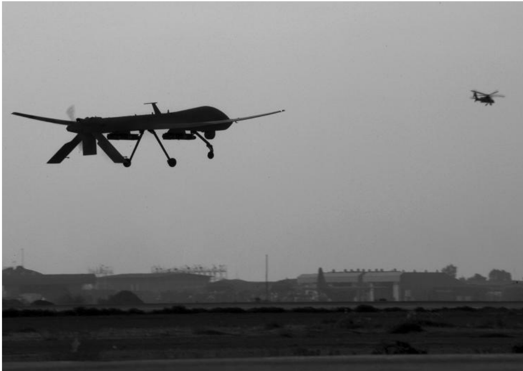
Εικόνα 4: DRONE τύπου Predator. Ένα από τα μη επανδρωμένα αεροσκάφη τα οποία χρησιμοποιεί η CIA για τις εκτός των συνόρων αποστολές της.

από τα πρώτα χτυπήματα της συγκεκριμένης τεχνολογίας που γινόταν στην Υεμένη και τρίτον ήταν το πρώτο ατυχές περιστατικό για τις Η.Π.Α. καθώς στην επιχείρηση κατά της Παγκόσμιας Τρομοκρατίας σημειώθηκε και ο πρώτος θάνατος Αμερικανού πολίτη.