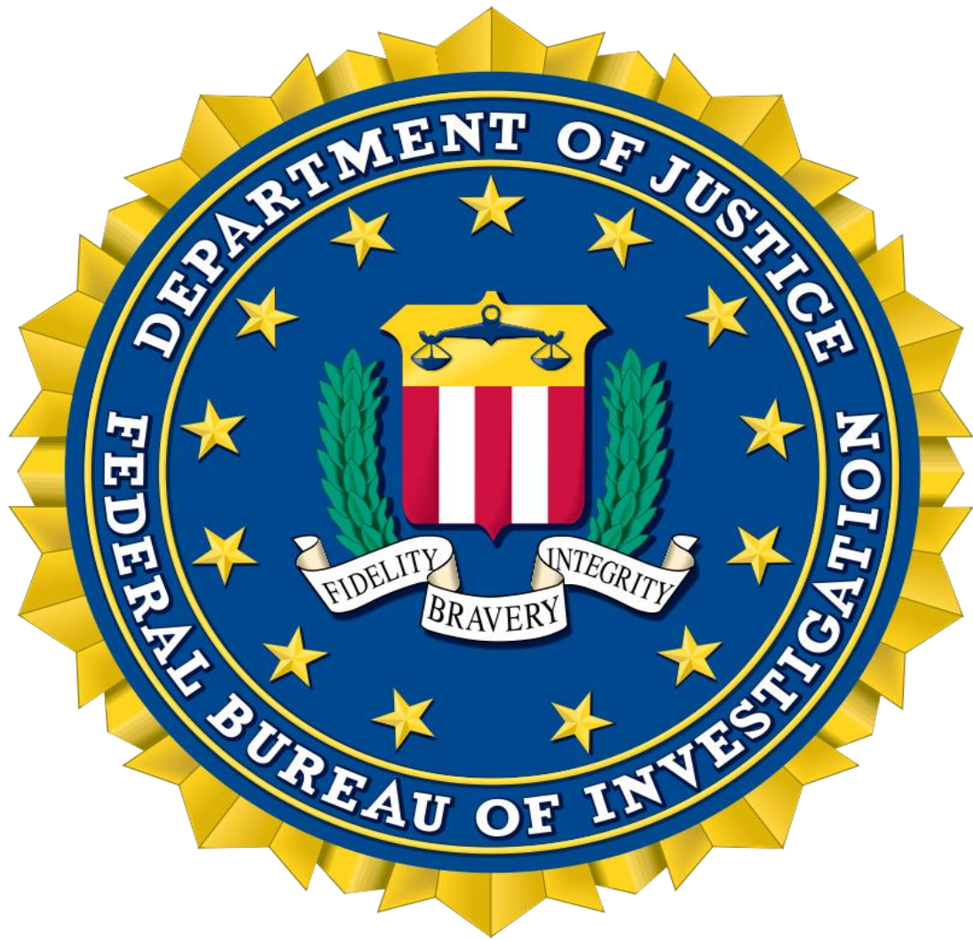
Εικόνα 5: Το έμβλημα του Ομοσπονδιακού Γραφείου Ερευνών , ή όπως αλλιώς έχει γίνει ευρέως γνωστό, του FBI. Στο κέντρο του σήματος διακρίνονται τα τρία χαρακτηριστικά ρητά που αντιπροσωπεύουν την ομοσπονδιακή υπηρεσία: Πίστη. Γενναιότητα. Ακεραιότητα.