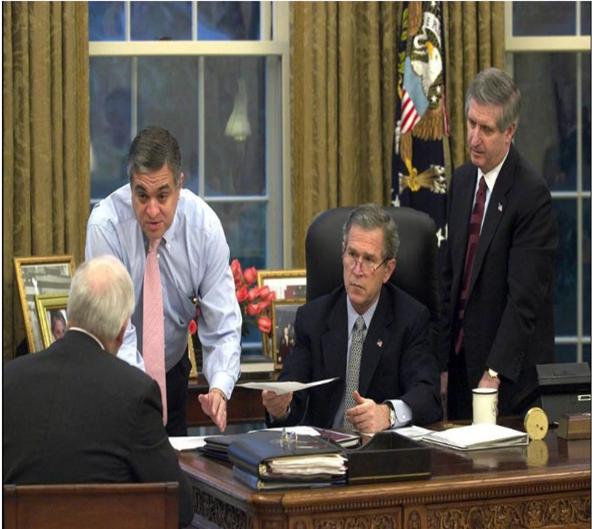
Εικόνα 10: Ο Πρόεδρος Bush μαζί με τον διευθυντή της Κεντρικής Υπηρεσίας Πληροφοριών (CIA) George Tenet στο Οβάλ Γραφείο

Η κήρυξη πολέμου από τον George Tenet ήταν ισχυρή και έδειξε μια σαφή κατανόηση της ζοφερής κατάστασης που είχε δημιουργηθεί, και του πραγματικού κινδύνου που έστρεφε τα φώτα του στην Αμερική, όμως παρόλα αυτά θα μπορούσε να ειπωθεί πως η δήλωση αυτή δεν είχε κάποια επίδραση ή κάποιο αποτέλεσμα καθόσον ο Tenet δεν είχε την ευθύνη συντονισμού και συνεργασίας των υπηρεσιών και ενσωμάτωσης της στις πολιτικές καθώς τέτοιες ενέργειες γίνονται μόνο από τον εκάστοτε πρόεδρο που διατελεί και από το Εθνικό Συμβούλιο Ασφαλείας. Χρειάστηκε να περάσουν 2 κυβερνήσεις και σχεδόν 4 χρόνια για να οριστικοποιηθεί και να εκπονηθεί ένα σχέδιο που θα μπορούσε να μετριάσει την απειλή της εθνικής ασφαλείας των Η.Π.Α. και ο Πρόεδρος δεν είχε καν την ευκαιρία να δει το σχέδιο αυτό. Η πολυπλοκότητα των