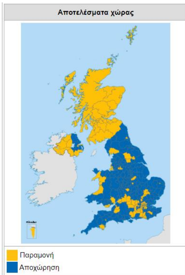
Εικόνα 3: Αποτέλεσμα βρετανικού δημοψηφίσματος