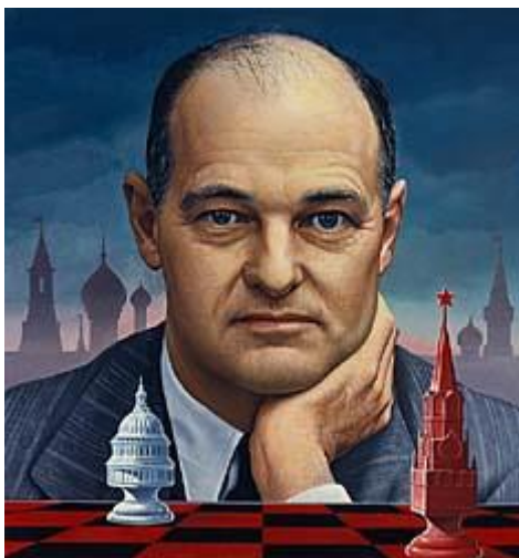
“portrait of Kennan by Ned Seidler” 42

Σύμφωνα με τον Kennan το σοβιετικό σύστημα ήταν ευάλωτο και ο Στάλιν δεν θα μπορούσε να διατηρήσει τα εδάφη που προσάρτησε αλλά ούτε και τις χώρες που ήταν υπό την κατοχή του. Ακόμα επισήμανε πως « Αυτό που οι ΗΠΑ πρέπει να κάνουν είναι να εκπαιδεύσουν τους δικούς τους πολίτες, να αντιμετωπίσουν τα βασικά εσωτερικά προβλήματα, να διατηρήσουν την αυτοπεποίθησή τους, και να ενεργήσουν με υπομονή ». 41