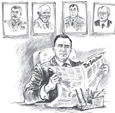
Andrey Gromyko-Russian Foreign Minister 49

“All Germans, wherever they live, should remember that the Soviet Union never wanted the dismemberment of Germany. It was the USA and Britain who at the three-power Allied conferences proposed tearing Germany apart.” 50