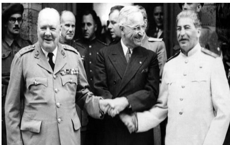
Από Αριστερά : Winston Churchill, Harry S. Truman, Joseph Stalin 29

Η διάσκεψη στο Πότσταμ διενεργήθηκε αμέσως μετά την λήξη του Δεύτερου Παγκοσμίου Πολέμου και διήρκησε από τις 17 Ιουλίου του 1945 μέχρι τις 2 Αυγούστου του ίδιου έτους ενώ έλαβε χώρα στο Πότσταμ της Γερμανίας. Πρόκειται για την τελευταία διάσκεψη των τριών μεγάλων ηγετών – νικητών του πολέμου. Πιο συγκεκριμένα, οι διαπραγματευτές της ιστορικής Διάσκεψης ήταν ο πρόεδρος των