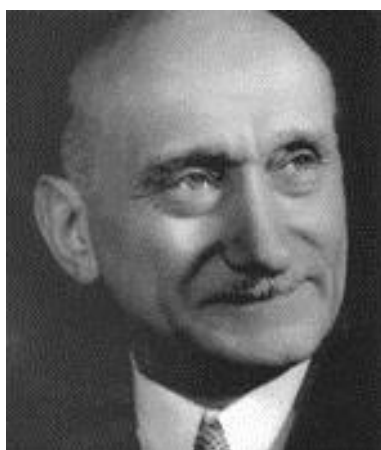
“Υπουργός Εξωτερικών Ρομπέρ Σουμάν” 60

την εντάξουν σε ένα δυτικό σύστημα συμμαχιών στο στρατιωτικό, οικονομικό και πολιτικό τομέα. Τελικά, η Γερμανία διαχωρίστηκε σε δύο τμήματα το δυτικό και την ανατολικό. Έτσι το διαμελισμένο γερμανικό κράτος αποτέλεσε τον προμαχώνα του ψυχρού πολέμου εκφράζοντας τα διαφορετικά εθνικά συμφέροντα εκατέρωθεν του “σιδηρούν παραπετάσματος”.