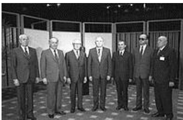
“Οι Ηγέτες του Συμφώνου της Βαρσοβίας το 1955, (από αριστερά): Χούζακ (Τσεχοσλοβακίας), Ζίβκοβ (Βουλγαρίας), Ε. Χόνεκερ (Α.Γερμανίας), Μ. Γκορμπάτσφ (ΕΣΣΔ), Ν. Τσαουσέσκου (Ρουμανίας), Β. Γιαρουζέλσκι (Πολωνίας) και ο Γ. Καντάρ (Ουγγαρίας).” 24

Το Σύμφωνο της Βαρσοβίας υπογράφηκε στις 14 Μαΐου του 1955 από επτά χώρες της ανατολικής και της κεντρικής Ευρώπης και πιο συγκεκριμένα από την Τσεχοσλοβακία, την Βουλγαρία, την Ανατολική Γερμανία, την ΕΣΣΔ, την Ρουμανία, την Πολωνία και την Ουγγαρία. Με το συγκεκριμένο Σύμφωνο, τα συμβαλλόμενα κράτη μέλη συμφώνησαν σε μία συμμαχία αμυντικού χαρακτήρα. Το Σύμφωνο της Βαρσοβίας αποτέλεσε μία διπλωματική κίνηση στρατιωτικού και αμυντικού χαρακτήρα η οποία ερμηνεύτηκε ως απάντηση προς το ΝΑΤΟ που είχε δημιουργηθεί έξι χρόνια νωρίτερα.