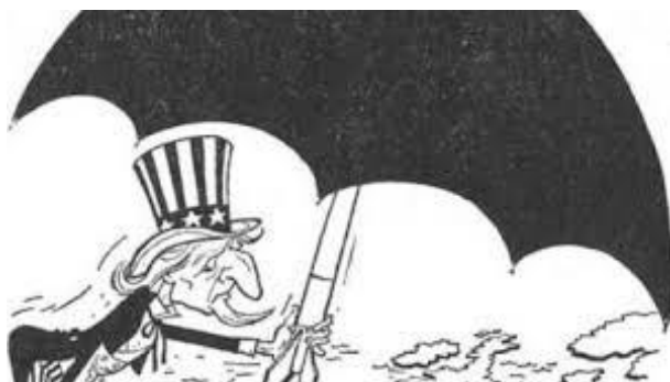
«Αμερικανική γελοιογραφία του 1947. Παρουσιάζει το μπάμπια Σαμ να προσφέρει ομπρέλα προστασίας στην Ευρώπη. Η ομπρέλα, όμως, κρύβει μια βόμβα...» 16 .

Ένα από τα ερωτήματα που προέκυψαν αναφορικά με το σκοπό του συγκεκριμένου εγχειρήματος έγκειται στο εάν το Σχέδιο Marshall αποτέλεσε μια γενναιόδωρη προσπάθεια ανασυγκρότησης της κατεστραμμένης, από το Δεύτερο Παγκόσμιο Πόλεμο, ευρωπαϊκής ηπείρου ή εάν θα αποτελούσε ένα μέσο ελέγχου και επιρροής προς τη Δυτική Ευρώπη. Με αυτόν τον τρόπο, οι Η.Π.Α. θα μπορούσαν να διασφαλίσουν πως η δυτική Ευρώπη θα απέφευγε το σοβιετικό έλεγχο και τη σοβιετική κυριαρχία, κάτι που δε συνέβη με την ανατολική. 15 Συνεπώς, οι Η.Π.Α. ακολούθησαν μια στρατηγική με την οποία επεδίωξαν να περιορίσουν τη μεγιστοποίηση ισχύος της Ε.Σ.Σ.Δ., βασιζόμενη στις αρχές του πολιτικού ρεαλισμού και χάραξαν τη στρατηγική τους με τέτοιο τρόπο ώστε να προστατέψουν το δικό της εθνικό συμφέρον.