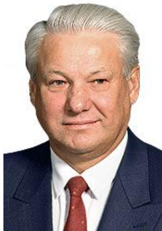
Μπορίς Γιέλτσιν, ο 1 ος πρόεδρος της Ρωσίας 69

«I ask to forgive me for not fulfilling some hopes of those people who believed that we would be able to jump from the grey, stagnating, totalitarian past into a bright, rich and civilized future in one go.» 70