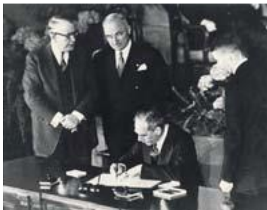
“Mr. Dean Acheson (US Minister of Foreign Affairs) signs the NATO Treaty” 22

κοινωνικό τομέα ήταν ανίκανες να αντιμετωπίσουν τη σοβιετική απειλή χωρίς την βοήθεια των ΗΠΑ. Συγκεκριμένα : « Η Γερμανία ήταν σωριασμένη σε ερείπια , και ούτε η Γαλλία ούτε το Ηνωμένο Βασίλειο είχαν τη δυνατότητα να σταματήσουν τον πανίσχυρο κόκκινο στρατό, ο οποίος είχε συντρίψει την ίδια εκείνη Βέρμαχτ η οποία είχε νικήσει εύκολα τον βρετανικό και τον γαλλικό στρατό το 1940 » 21 .