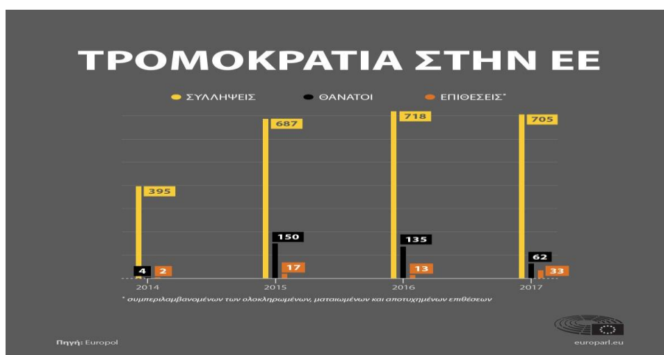
Εικόνα 2: Η τρομοκρατία στην Ε.Ε.

Τα τελευταία χρόνια παρατηρήθηκε αύξηση των τρομοκρατικών απειλών και επιθέσεων, με αφετηρία το έτος 2015 που σημειώθηκε επίθεση στο γραφείο του περιοδικού «Charlie Hebdo» στο Παρίσι. Αυτές οι επιθέσεις πραγματοποιήθηκαν από δράστες που κατευθύνονταν από το Ισλαμικό Κράτος (IS) ή εμπνεύστηκαν από την θρησκευτική ιδεολογία και τη ρητορική του.