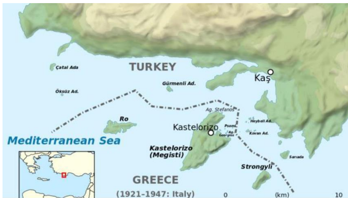
Εικόνα 3 Διεκδικήσεις της Τουρκίας για την ΑΟΖ

Παράλληλα στην εικόνα 3 παρουσιάζονται οι διεκδικήσεις της Τουρκίας.