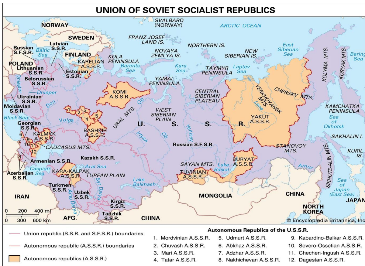
Χάρτης 1 : Η Σοβιετική Ένωση χωρισμένη ανά Σοβιετική Σοσιαλιστική Δημοκρατία.