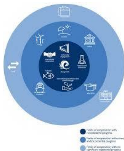
Εικόνα 2: Η εξέλιξη που έχει σημειωθεί μέχρι το 2019 στους τομείς συνεργασίας της Συνέργειας