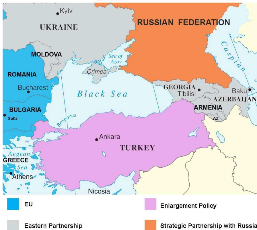
Εικόνα 1: Χάρτης συγκλιουσών πολιτικών της ΕΕ στην περιοχή του Εύξεινου Πόντου